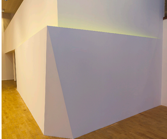
Harstad - Anders Sletvold Moe - Extended corner