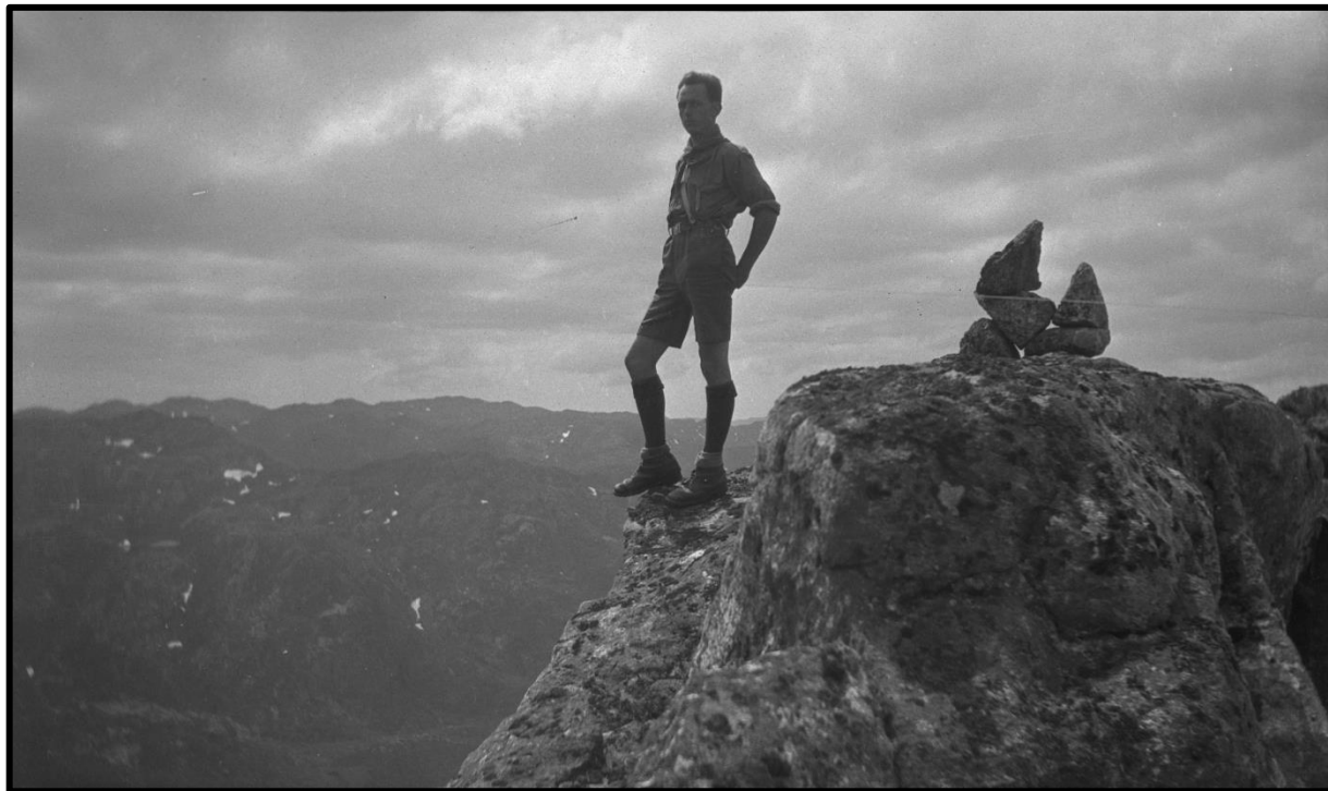
Selvportrett på Madlandshei eller Litle Gloppedalen, sommeren 1926.