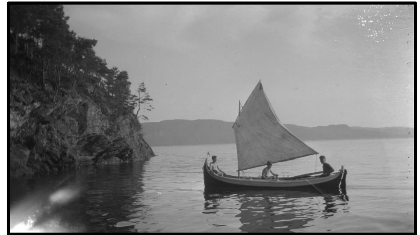
Seile- og rotur med Nordlandsbåt i Ryfylke.