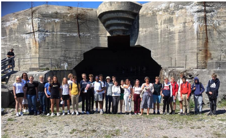
Stolte elever og lærere foran kasematten under åpningen av «Ungdom møter Møvik», 16. juni 2020.

Vi fikk intervjumaterialet overlevert fra skolen på en minnepenn i februar. En måned seinere stengte hele Norge ned, men vi arbeidet fram mot ferdigstilling av presentasjonen av materialet i kasematten på Kristiansand kanonmuseum – filmene på skjerm i et eget, åpent rom; intervjuene som lyttestasjoner. Elevene hadde arbeidet med å finne «gullkorn» i intervjumaterialet sitt, dvs. opplysninger de syntes var spesielt interessante å formidle. Flere strevde med dette, så museet foretok for en stor del det endelige utvalget, men utdrag fra samtlige intervjuer ble med i utstillingen.